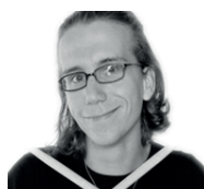
J. Schubert Schlagzeug Klavier