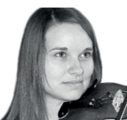
A. Büeler Violine