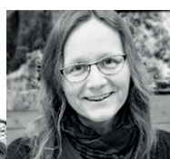
M. Haupt Klavier