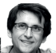
J. Gassmann Blockflöte