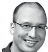
J. Schwalm Gitarre