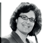
B. Schlatter Querflöte