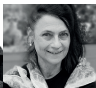
S. Weiss Klavier Keyboard