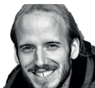
A. Vogel Klavier Keyboard